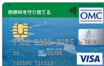
熱帯林を守り育てる