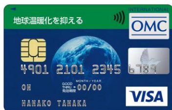
地球温暖化を抑える