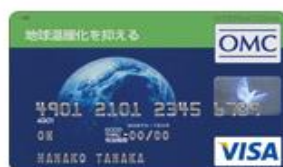
地球温暖化を抑える (Visa)