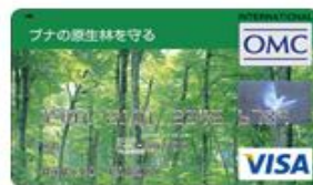
ブナの原生林を守る (Visa)